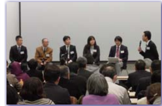
平成27年度 東日本大震災アーカイブ国際シンポジウム