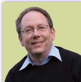
ハーバード大学歴史学教授 エドウィン・O・ライシャワー日本研究所 JDArchive プロジェクトディレクター アンドルー・ゴードン氏